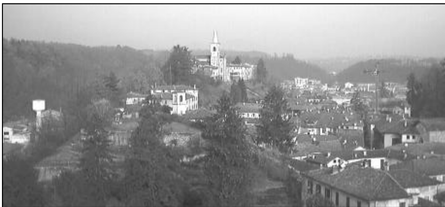
Vista di Castiglione Olona

In questi mesi ci hanno più volte ripetuto di essere più bravi degli amministratori di Castiglione. Intanto a Castiglione le antenne non possono essere messe nel centro abitato, se a Malnate potranno essere messe ricordiamoci di ringraziare "i più bravi".