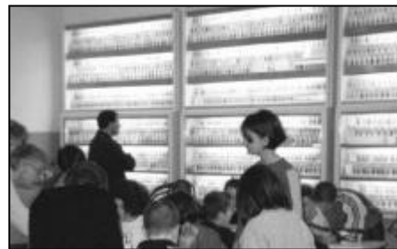
La raccolta di sabbie del museo

E quando non ci sarà più nulla se non sabbia, ogni minuscolo granello sospirerà tristemente ad un mondo deserto "taman shud... taman shud". E' finita. Basta. E' la fine.