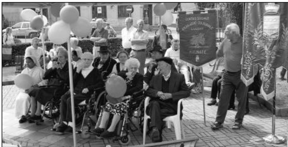
Nella foto Buzzoni-La Focale, il gruppo dei centenari durante la consegna degli attestati

S ono ben dodici i cittadini malnatesi che hanno raggiunto o sorpassato il secolo di vita che giovedì 2 giugno sono stati festeggiati con la manifestazione "Cent'anni di gratitudine", l'iniziativa inaugurata lo scorso anno dall'Amministrazione comunale e che quest'anno è stata inserita nelle celebrazioni per la Festa della Repubblica.